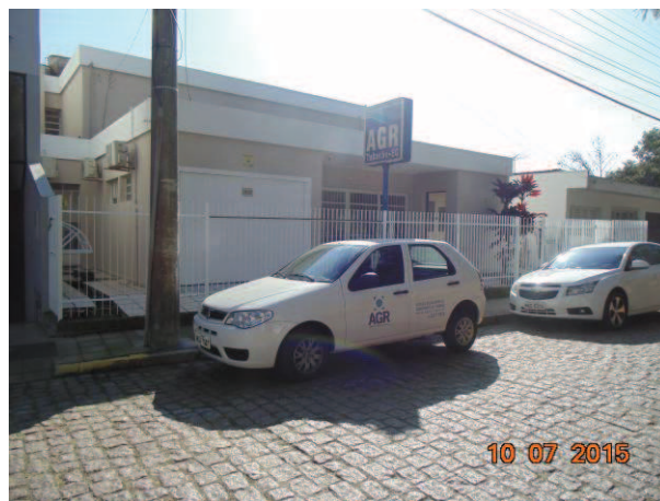
Sede da AGR – Rua Piedade 242 - Centro