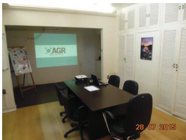
Sala de Reuniões

A estrutura orgânica da AGR-Tubarão é composta pelo Conselho Consultivo, pela Superintendência, a Secretaria Executiva e a Ouvidoria. (Artigo 5º da Lei Complementar 020/2008). As informações pertinentes a cada uma das estruturas serão detalhadas em seus respectivos tópicos ao longo do relatório.