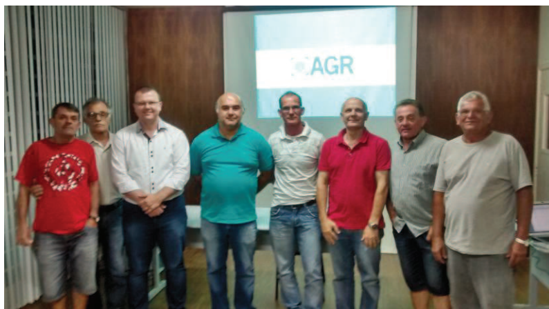
Foto dos presentes após eleição do representante dos usuários e suplente.