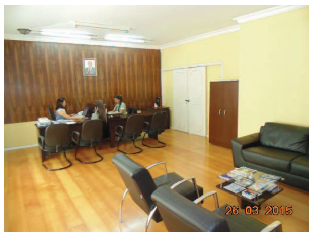
Atendimento aos usuários

A sede da AGR-Tubarão localiza-se no pavimento térreo de um edifício localizado na Rua Piedade, nº 242, centro, Tubarão, SC, CEP 88701 – 200, locada de terceiros. Contendo ambiente adequado para o desenvolvimento de suas atividades.